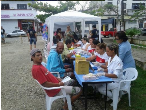
Campanha Novembro Azul

Rua Maria Ribeiro Resterich, nº461 – Vila Sorocabana – Pedro de Toledo – SP Cep-11.790-000 – Telefones – 0xx13-3419-2776 – 3419 - 1722 Site: www.projetorespeitar.org.br email: ct@projetorespeitar.org.br