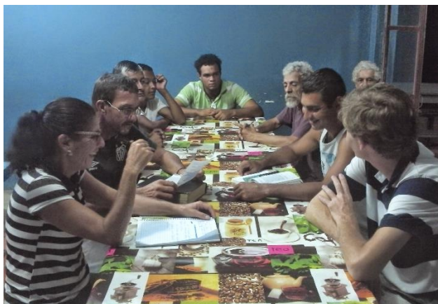
GRUPO DE LEITURA SÓ POR HOJE