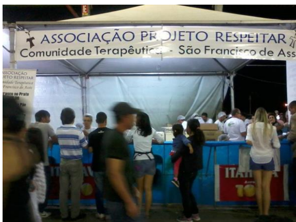
Participação dos acolhidos Quermesse na cidade de Registro

Vila Sorocabana – Pedro de Toledo – SP 0xx13-3419-2776 – 3419 - 1722 email: ct@projetorespeitar.org.br