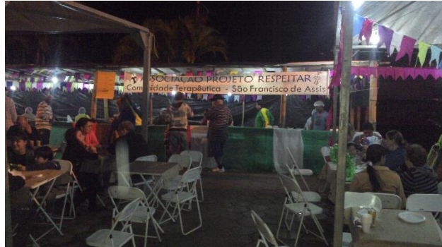
Participação dos acolhidos Campanha de arrecadação de fundos da APAE

CRCE – Certificado de Regularidade Cadastral de Entidades – nº1307/2013