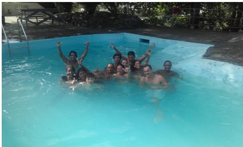
LAZER COM OS FAMILIARES