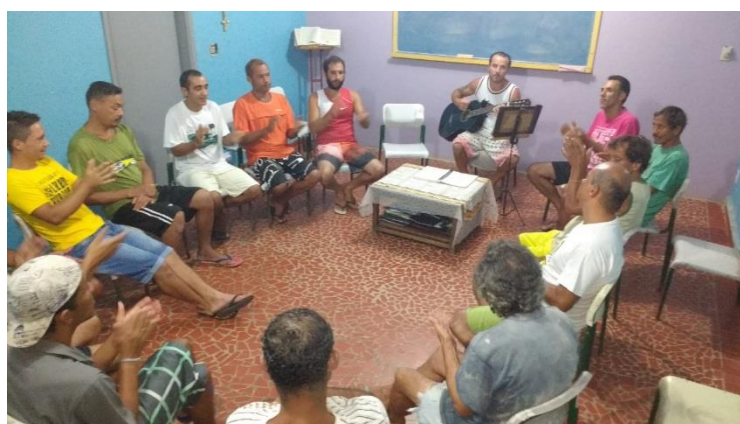
GRUPO DE LEITURA ESPIRITUALIDADE

Rua Maria Ribeiro Resterich, nº 461 – Vila Sorocabana – Pedro de Toledo – SP