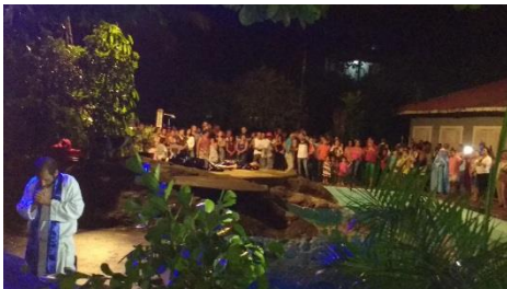
Encenação da Paixão de Cristo na C.T. Com a participação dos acolhidos e cidadãos de Pedro de Toledo